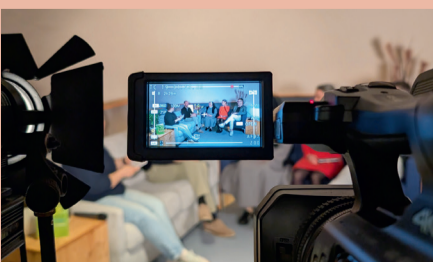
Die Teilnehmenden der Diskussionsrunde – live gestreamt.